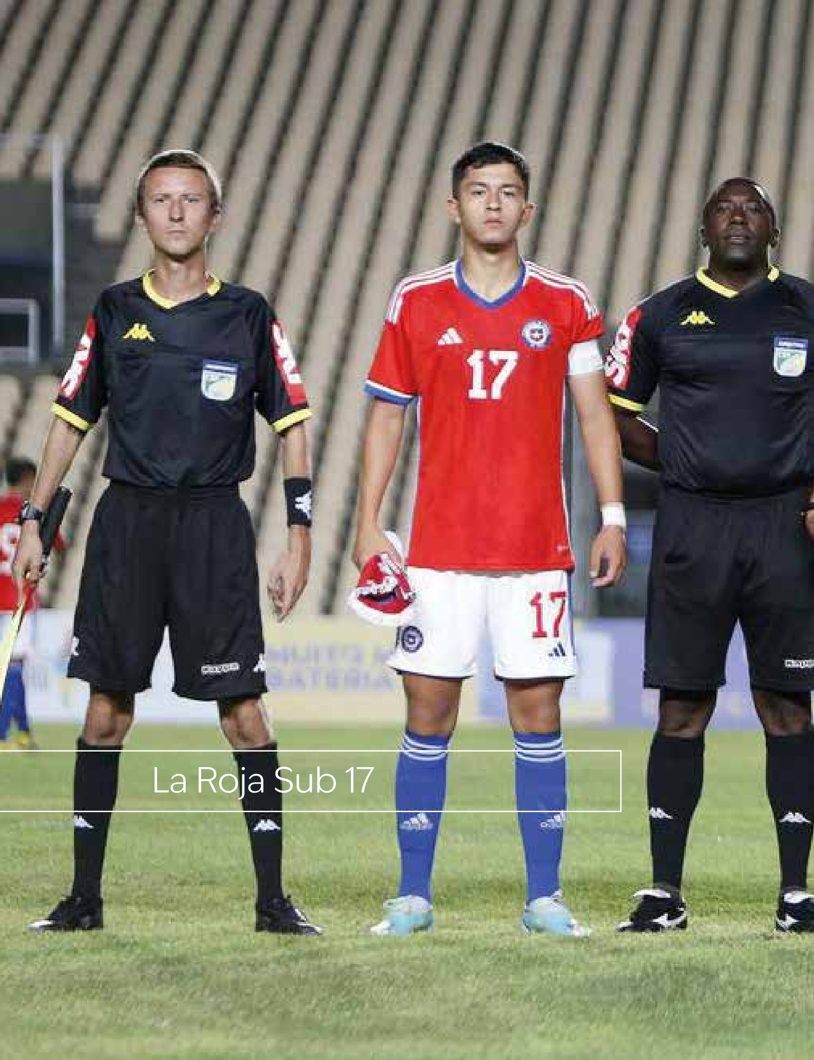
La Roja Sub 17