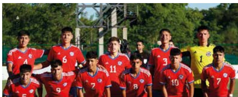
CUADRANGULAR INTERNACIONAL SUB 17 PARAGUAY - JAPÓN - CHILE - COLOMBIA