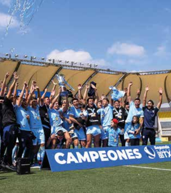
TABLA DE POSICIONES SEGUNDA DIVISIÓN GRUPO TX 2022