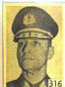
316 Eduardo Yáñez