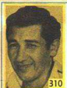
310 Luis Ayala

El deporte chileno tiene en su ancha historia figuras de corte mundial, de las cuales todos por igual nos enorgullecemos, pues en ellas se encuentran simbolizadas las mejores y más claras virtudes de la raza. Por esta razón, en esta página les rendimos nuestra más franca admiración y nuestro reconocimiento y homenaje más sinceros.