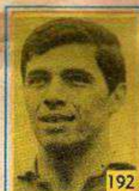
192 Elías Figueroa